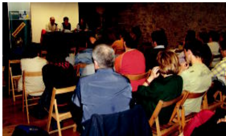
Hamarnaka herritar bildu zen hiru auzipetuen hitzaldia entzuteran. J. GONZALO

DONIBANE Musika Jardunaldietan elizako organoak 100 urte bete dituela ospatuko dute 7